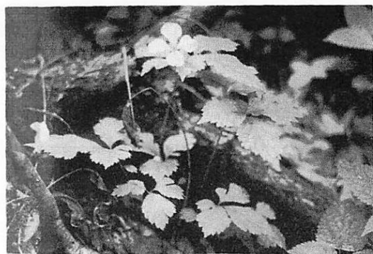
写真3 ヤマブキソウ Chelidonium japonicum ( '72.6.4 白石・小原)