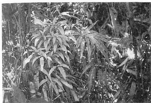
写真1 オオバノイノモトソウ Pteris cretica の新北限 ('72.5.28 女川・出島)