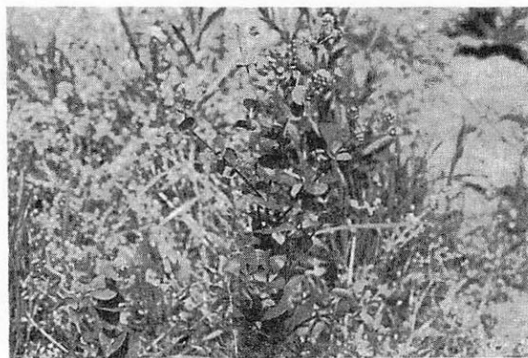
写真4 コシミノナズナ Lepidium perfoliatum ( '72.5.3 白石・鉢森山)